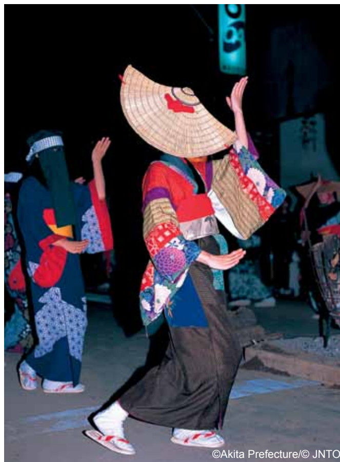
Taniec w Nishi-monai

Jednym z bardzo ważnych elementów w obchodach tego święta są bon odori , czyli tańce obon . Są one wy-