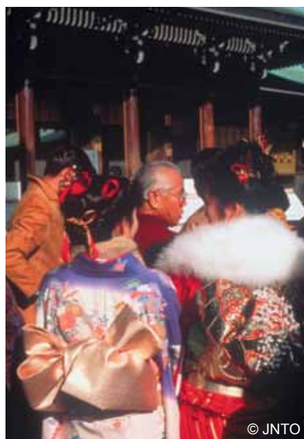
Seijin no hi

Zimowa pogoda i obfite opady śniegu w północnych regionach Japonii to doskonała okazja do organizacji festiwalu. W styczniu i w lutym w Sapporo oraz innych miastach wyspy Hokkaidō odbywają się festiwale śniegu ( yuki matsuri ). Z tej okazji ze śniegu i lodu budowane są rzeźby o najprzeróżniejszych kształtach, sięgające kilku, a nawet kilkunastu metrów wysokości. Te ogromne konstrukcje co roku przyciągają dziesiątki tysięcy widzów zarówno z Japonii, jak i zagranicą, którzy przyjeżdżają podziwiać ten niezwykły i dostępny jedynie przez krótki okres widok.