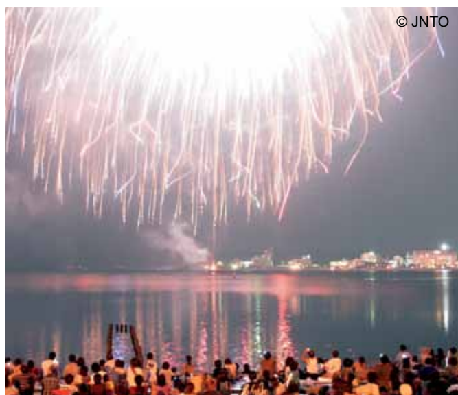
Festiwal Suigo-sai w Shimane