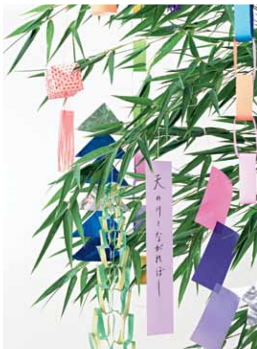
Gałęzie bambusa z tanzaku

busowymi gałązkami, do których przywiązują paski kolorowego papieru z wypisanymi życzeniami ( tanzaku ). Tradycja mówi, że życzenie powinno mieć formę poematu zapisanego pismem kaligraficznym. Takie życzenia zawieszają się na gałązkach w pierwszych dniach lipca, a w dniu święta – siódmego lipca, puszcza się je z nurtem rzeki, aby mogły się spełnić. Święto Gwiazd jest dniem wyjątkowym, pełnym optymizmu i nadziei na spełnienie życzeń i marzeń.