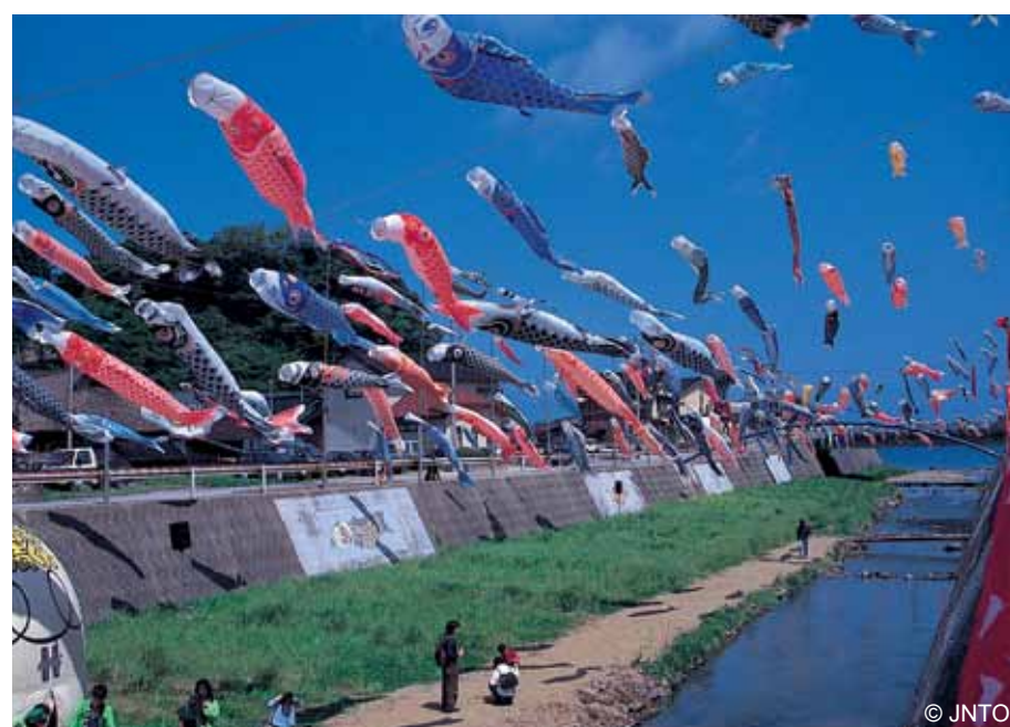
Koinobori w prefekturze Ishikawa

celu uczczenie zdrowego rozwoju dzieci i nie jest jasne, kiedy stało się świętem poświęconym wyłącznie rozwojowi chłopców. W połowie okresu Edo rodziny, w których urodził się chłopiec zaczęły wywieszać chorągiewki w kształcie karpia oraz wystawiać miniaturowe reprodukcje hełmów, zbroi, łuków i strzał oraz mieczy. Zwyczaj ten wywodzi się najprawdopodobniej ze starojapońskiego wierzenia, iż karp jest tak silny, że potrafi płynąć pod prąd rwącego potoku i przeskakiwać wodospady. Uważa się powszechnie, że wywieszanie chorągiewek to wyrażenie życzenia, by chłopcy wyrastali zdrowi i silni jak te ryby. Później zaczęto wystawiać też lalki przedstawiające wojowników w hełmach, które dały początek musashi ningyō (żołnierzyki) i gogatsu ningyō (lalki majowe). Lalki te można oglądać do dzisiaj. Jedną z najbardziej reprezentatywnych lalek, obok wojowników, jest Kintarō, lalka przedstawiająca chłopca o herkulesowej budowie, który wyrósł na generała.