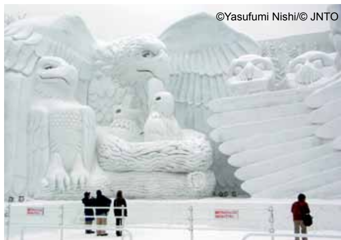
Festiwal śniegu w Sapporo