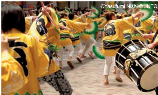
Festiwal Aoba w Sendai