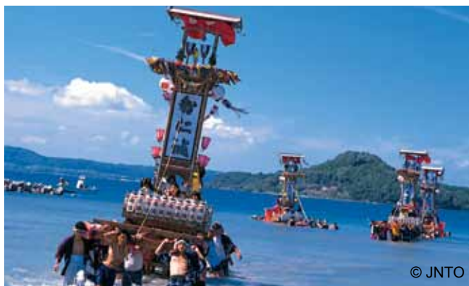
Festiwal Okinami Tairyō