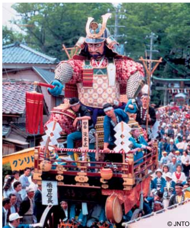
Festiwal Mikuni w prefekturze Fukui

Pochodzenie świąt i festiwali jest różne. Część z nich wywodzi się z obrzędów religijnych – rodzimego shintō (obchody Nowego Roku) lub buddyzmu ( obon ). Poza tym, jako że naturalny rytm przyrody odgrywa ogromną rolę w życiu Japończyków, wiele z festiwali związanych jest ze zmianami pór roku. Hanami , czyli podziwianie kwiatów wiśni, to wielowiekowa tradycja. W porze kwitnienia wiśni parki są tłumnie odwiedzane przez Japończyków, którzy wspólnie spędzają czas, nierzadko do późnego wieczora, pod drzewami obsypanymi delikatnymi kwiatami. Z kolei na północy Japonii, na wyspie Hokkaidō, gdzie zimą występują obfite opady śniegu, organizowane są festiwale śniegu (więcej o nich na stronie 4). Trzecią kategorią są pielęgnowane do dziś zwyczaje i tradycje ludowe. Należą do niej różnorodne, charakterystyczne dla danego regionu lokalne festiwale, obchodzone od dawna w całym kraju. W niniejszym biuletynie chcemy przybliżyć Państwu barwny świat japońskich świąt i festiwali, przedstawiając najważniejsze z nich.