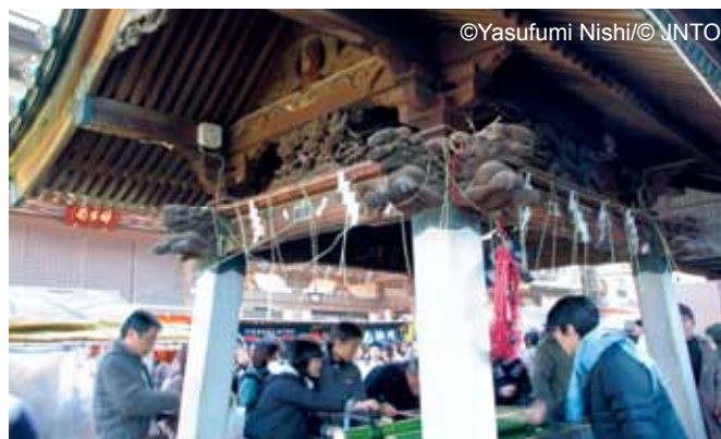
Wizyta w świątyni