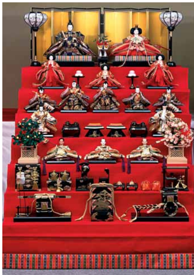
Zestaw hina ningyō

5 maja obchodzone jest tango no sekku , czyli święto chłopców. Tego dnia można zobaczyć powiewające na wietrze chorągiewki w kształcie karpia ( koinobori ). Ma ono bardzo długą historię, według zapisków obchodzone jest od 700 r. Początkowo święto miało na