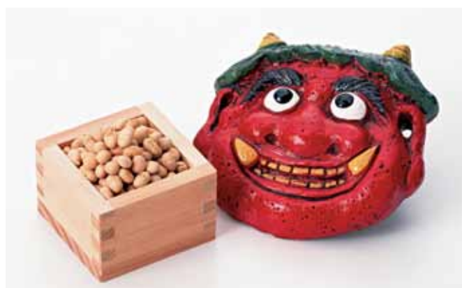
Ziarna soi i maska oni

Setsubun wiąże się z dniem poprzedzającym rozpoczęcie wiosny, lata, jesieni i zimy według kalendarza księżycowego. Współcześnie obchodzony jest 3 lutego. Tego dnia Japończycy rozrzucają prażone ziarna soi tak wewnątrz jak i na zewnątrz domów, wykrzykując przy tym oni wa soto, fuku wa uchi („Przyjdź szczęście, precz demony”). Zwyczaj ten, praktykowany w całej Japonii, ma na celu zwabienie szczęścia i wygnanie nieszczęść w nadchodzących miesiącach. W dawnej Japonii w świątyniach i klasztorach odbywała się uroczystość wypędzania złych mocy. Później, choć nie jest jasne kiedy i dlaczego, dodano zwyczaj rozrzucaania prażonych ziaren soi dla odpędzenia demonów.