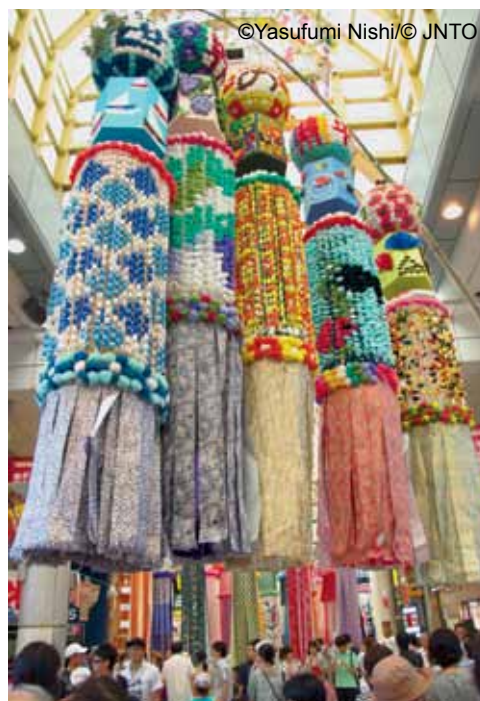
Tanabata w Sendai