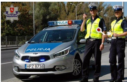
一般的な警察車両及び警察官の制服