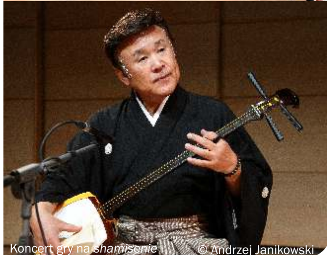
Koncert gry na shamisenie