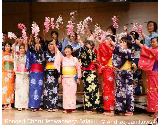
Koncert Chōru Jedwabnego Szlaku