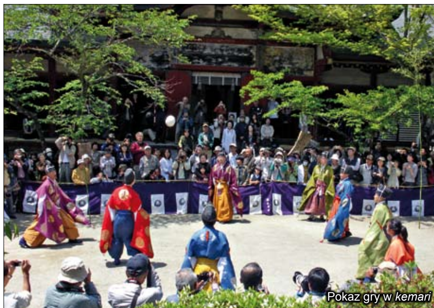
Pokaz gry w kemari

Jedną z najbardziej znanych gier dworskich jest kemari , czyli dosłownie „piłka kopana”. Rozgrywka przypomina współczesną grę w „zośkę” – arystokraci, w grupie od pięciu do ośmiu osób, ustawiali się na boisku i starali jak najdłużej utrzymać w powietrzu skórzaną