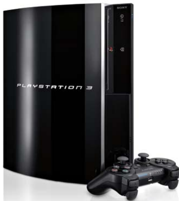
Flagowy produkt firmy Sony – konsola Play Station 3

Oprócz konsol, w Japonii cały czas popularne są także salony gier, w których wizyta jest częstą formą rozrywki młodych ludzi. Również tutaj Japończycy wyznaczają światowe trendy. Wystarczy wymienić choćby takie tytuły jak Tekken, Virtua Fighter czy Dance Dance Revolution, które można uznać za ikony światowego przemysłu rozrywkowego.