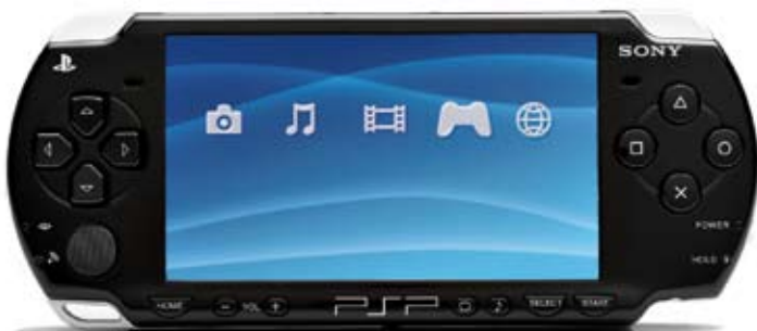
Przenośna konsola PSP Slim firmy Sony

Choć powszechny jest stereotyp Japończyków jako ludzi poważnych, nie sposób zaprzeczyć, że potrafią się dobrze bawić i w przeciągu ostatnich kilkudziesięciu lat wnieśli ogromny wkład w kulturę światową, tworząc nowe standardy rozrywki elektronicznej. Oprócz wymienionych już Nintendo czy Sony, każdy szanujący się gracz zna takie nazwy jak Sega, Konami oraz Namco – firmy które odmieniły świat gier wideo.