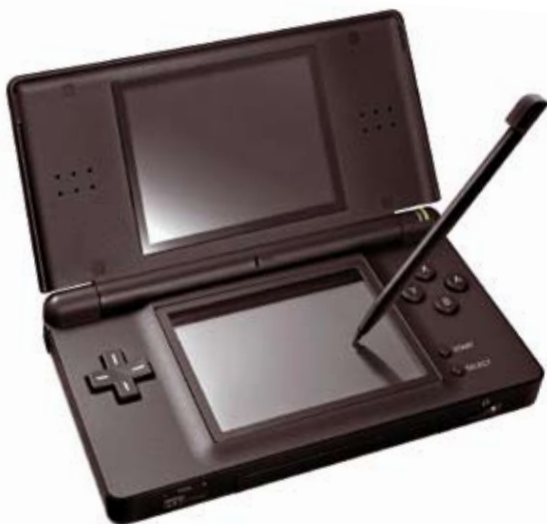
Konsola Nintendo DS z ekranem dotykowym

Obecnie, po blisko 30 latach, japońskie firmy nadal pełnią czołową rolę w przemyśle rozrywkowym. Ich produkty, takie jak Play Station 3 czy Nintendo Wii są obiektem marzeń wielu graczy. Premiera nowego urządzenia lub gry jest dla fanów niezwykle ważnym wydarzeniem, a długie kolejki ustawiają się przed sklepami nawet na kilka dni przed rozpoczęciem sprzedaży.